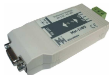
Interfejs łączący urządzenia z komputerem