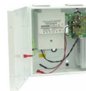
Zasilacz podtrzymujący system w razie awarii zasilania z sieci