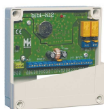
Kontroler systemu obsługujący do 10 tys. pracowników