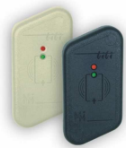
Dwa czytniki do odczytu kart