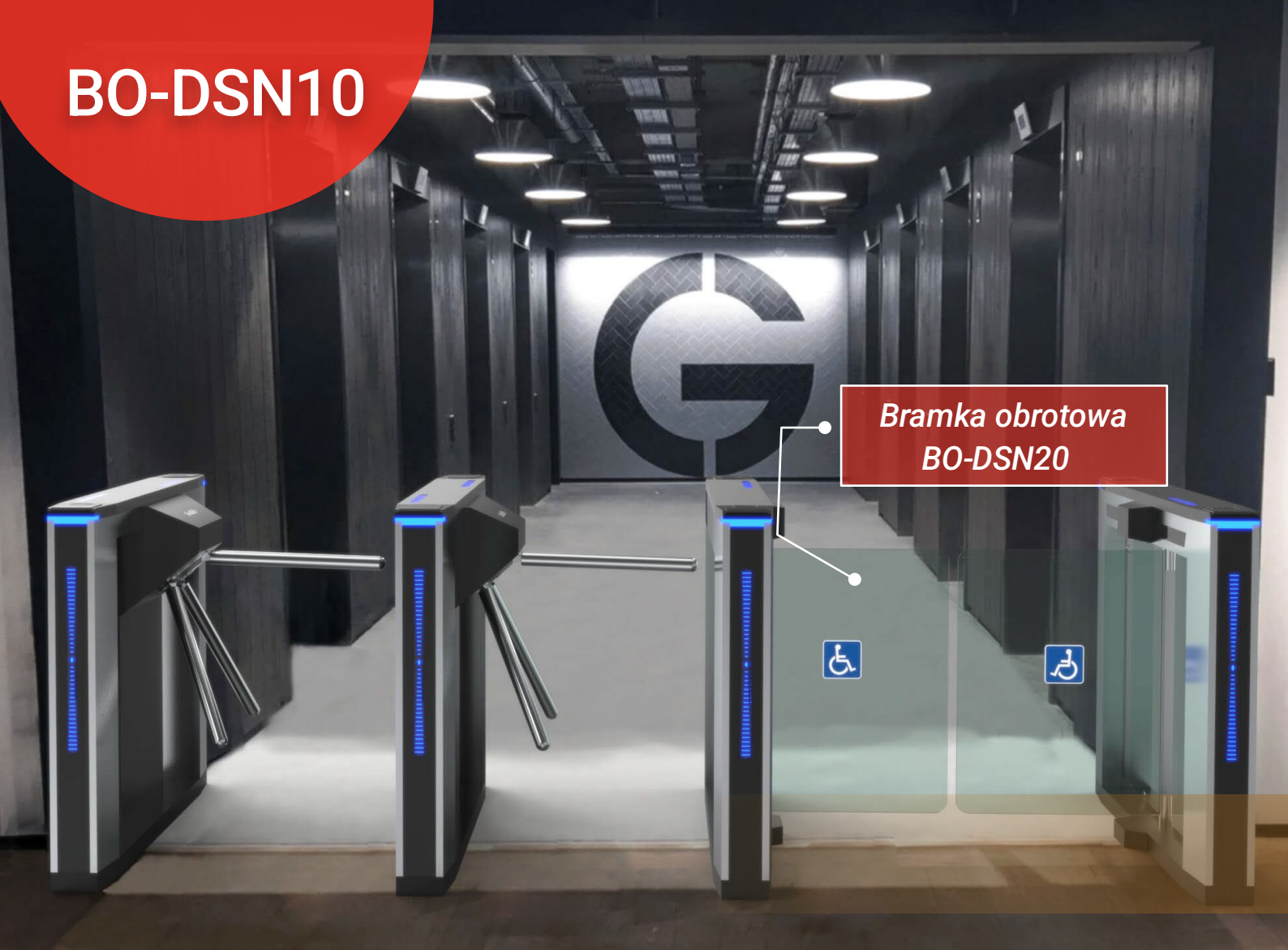
Bramka obrotowa BO-DSN20

Bramka obrotowa BO-DSN10 oferuje wiele zaawansowanych funkcji takich jak np. anti-trailing (jedna osoba przejdzie w jednym cyklu). Bramka może posiadać szerokość przejścia do 1100mm przez co jest odpowiednia dla osób niepełnosprawnych poruszających się na wózku inwalidzkim.